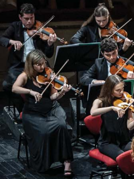
Hawijch Elders durante la Finale al Teatro alla Scala

Il "Premio Mormone", organizzato dalla Fondazione La Società dei Concerti di Milano e ideato dalla sua presidente Enrica Ciccarelli , con il patrocinio del Ministero della Cultura e del Comune di Milano e il contributo di Regione Lombardia e Fondazione Cariplo , è un concorso unico nel panorama internazionale, perché i concorrenti non vengono giudicati soltanto